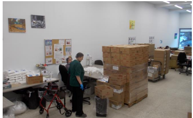
Vue de l'atelier