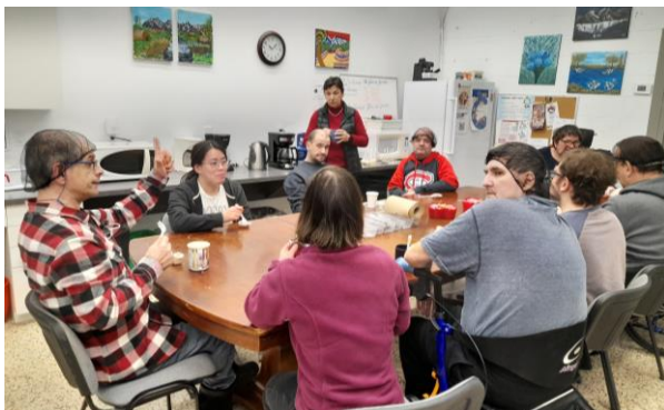
Les participants réunis dans la cuisine pour déguster les chocolats de la Saint-Valentin