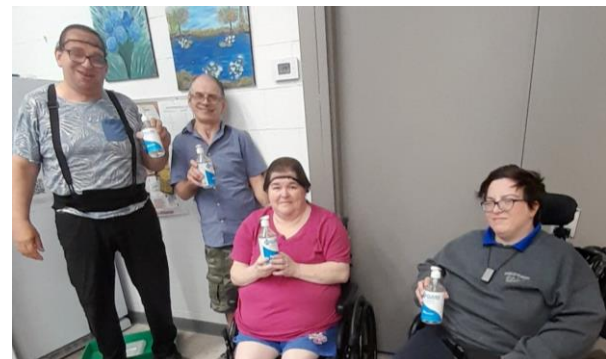
Une partie de l'équipe remerciant l'entreprise ADFAST pour son don de gel hydroalcoolique