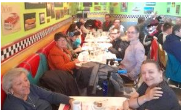
Sortie au restaurant Nickels, décembre 2022, Noël